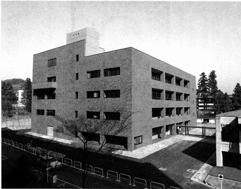
東北大学附属図書館新館（2号館）

本館西側に地上4階建（延5,734.46㎡） 書架スペース・視聴覚室・貴重書展示室・ゼミナール室・研究個室・会議室等を備え、平成2年4月から利用開始。